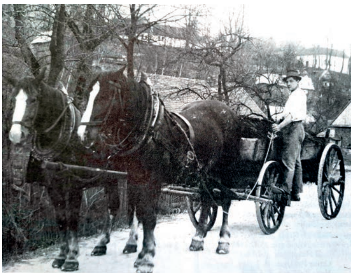
Litrbachy ve 30. letech minulého století, místní část Čtyři dvory (Vierhöf - statky č.p. 97, 99, 100 a 101), pohled od křížovatky pod „Benešákem“.

V naší obci vzácný případ zástavby v údolí, ve svahu (kolem cesty) a zároveň na kopci současně.