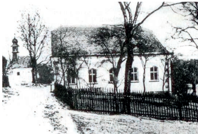
Brlenka - Urbanova hospoda č.p. 1 a kaplička, pohled od Čisté, nedatováno.